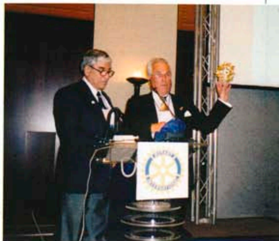
Представителят на президента на РИ Уолтър Маддокс получава златен лавров венец от дистрикт гуверньора